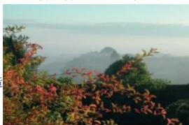
Ainsworths Bach Flower Gardens

エイズワースは、英国フラワーエッセンス製造者協会(BAFEP)の設立者であり、メンバーです。BAFEPはバッチフラワー及び他のエッセンス製造者の協会であり、最高レベルの基準を設置及び維持し、薬事関連の要求事項も行なっています。